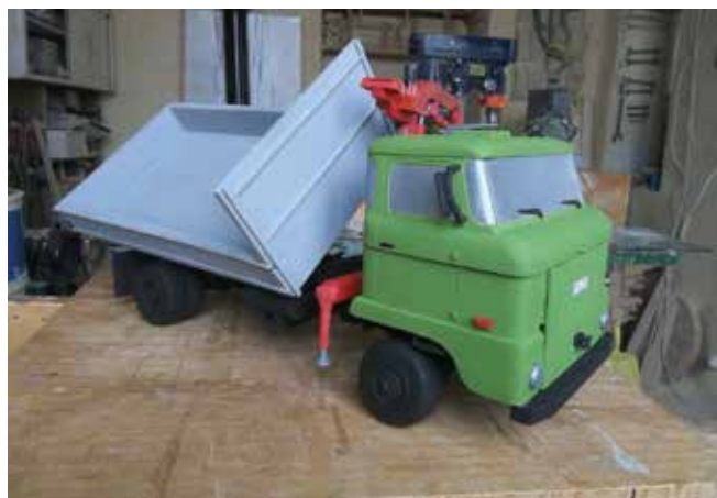
Index, ajtózsanér és még billen is a plató...