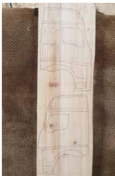
A kabin oldalainak felrajzolása.