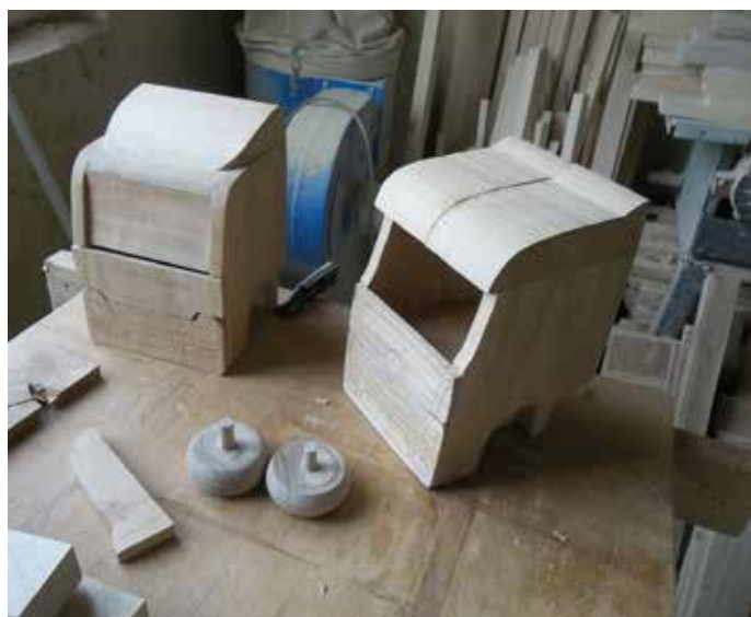
A nagyolt kabinok.