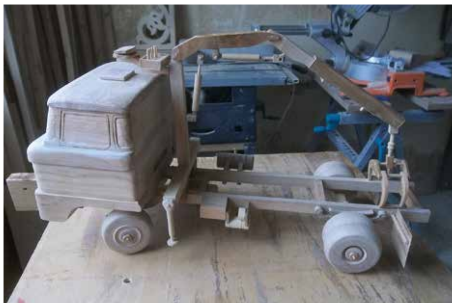
Légtartály, hidraulikai hengerek és a klasszikus ikerkerék a gumileffentyűvel.