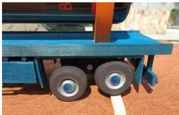
A hátsó híd is funkcionális.