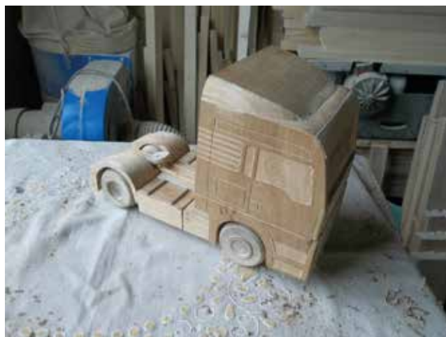
A modelleken jól látszik, hogy milyen részletekbe menő munkát végez a készítő.