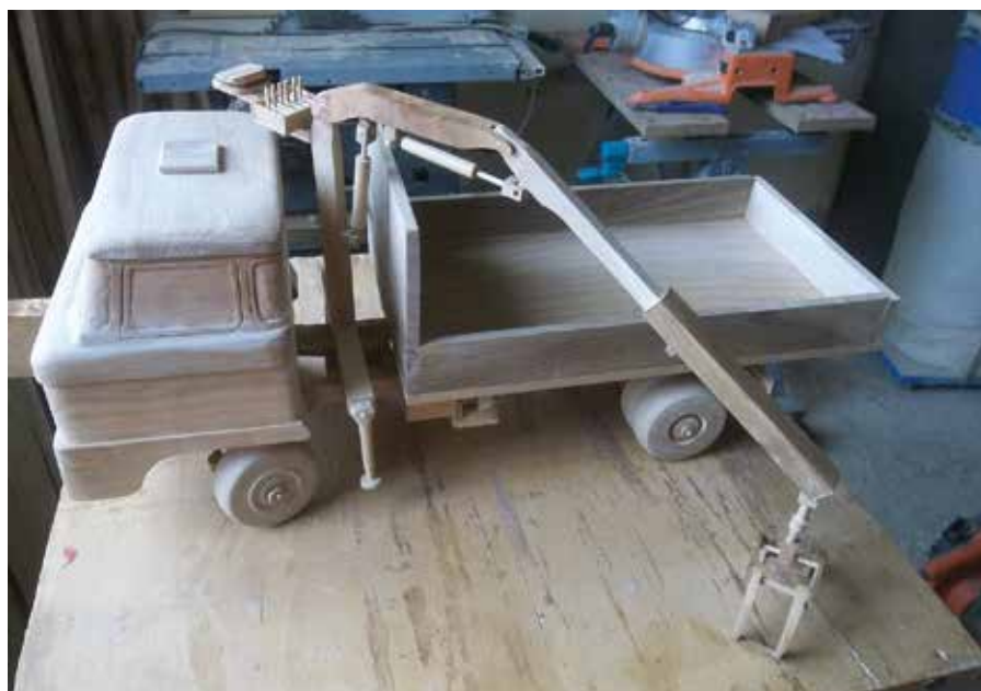
IFA L60 festés nélkül.