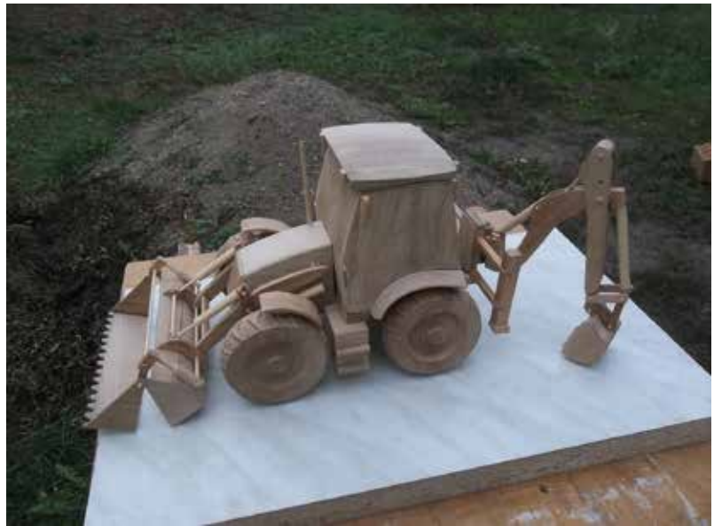
Festésre váró JVC munkagép. Természetesen minden elem mozgatható és követi az eredetit.

A modellek akrilfestést kapnak. A feliratokat kézzel rajzolja elő, majd festi fel. Talán ez a legnehezebb része a munkának. Sokat nem lehet hibázni, hiszen akkor az