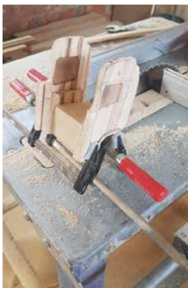
A kabin összeállítása.