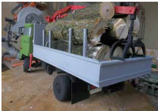
A rendszám alapján biztosan lekérdezhető a jármű múltja.

zol, tervez, majd főleg lucfenyőből kezdi el az alapokat kialakítani. Azon alkatrészeknél, melyeknél faragás szükséges, cseresznyefát, diófát és hársfát alkalmaz előszeretettel. A hagyományos alapgépeken kezdődik meg a munka. A keresztmetszeti megmunkáláson kívül rengeteg apró alkatrészt kell pontosan legyártani. Esztergagéppel készülnek a kerekek, míg a felnik nagyolása oszlopos fűrőgéppel. Ez utóbbi nagy szerepet játszik a nagyon pontos, egyenes csapos illesztéseknél, melyek vékony fogpiszkáló méretűek. Ilyenek vannak a tükröknél, a hidraulikai és mozgó elemeknél.